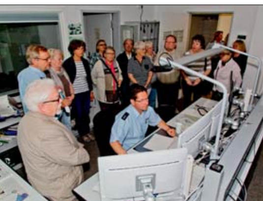
Auf der Polizeiwache.