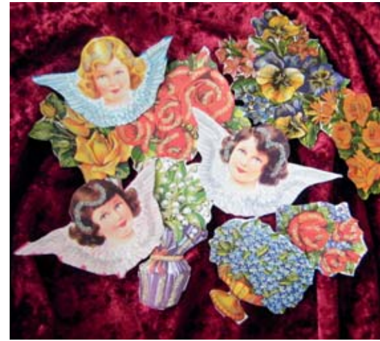
Nostalgie: Glanzbildchen.

Es ist wirklich kaum zu glauben, aber diese kindlich-naive Bewunderung steckt heute noch in mir, so viele Jahrzehnte später. Natürlich hat das mit Erfahrung und heutigem Wissen zu tun, und es ist mir auch unbegreiflich, wie man damals bei so grauenhaftem Erleben überhaupt an Qualität denken