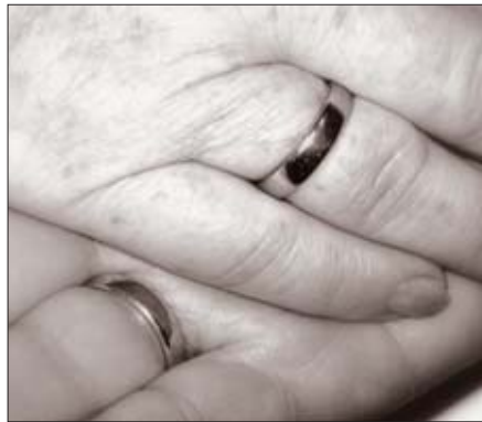
Ringe für die Ewigkeit.

Der Krieg war endlich vorbei, aber die Wunden, die er allenthalben geschlagen hatte, konnten nicht übersehen werden. Fast alle größeren deutschen Städte waren mehr oder weniger stark zerstört. Viele Menschen, soweit sie überhaupt noch eine Bleibe hatten, hausteten in Kellern, Hausruinen, Behelfsheimen oder auch in Luftschutzbunkern, die notdürftig umfunktioniert worden waren. Besonders schwer hatten die Frauen unter der Not zu leiden, deren Männer vermißt, in Gefangenschaft geraten oder gar gefallen waren. Nicht selten standen sie nachts auf, um stundenlang bei eiskaltem Winterwetter in einer Menschen Schlange vor einem Brotgeschäft auszuharren, bis die Lieferung eintraf. Die geringen Rationen, die es auf Lebensmittelkarten gab, reichten nicht aus, um satt zu werden. Oft bekam man nicht einmal diese. Mitunter war das Warten in der Schlange vergeblich, weil das letzte Brot wenige Kunden vorher verkauft wurde. Dann war