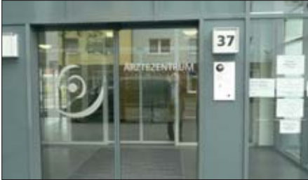
Die Notfallambulanz.

von diesen die Rater Ambulanz geschlossen wird, ist noch nicht entschieden. Falls es so kommen sollte, bietet die KVNO noch die Möglichkeit, eine Dependence für Ratingen zu beantragen. Die Reform soll der Gerechtigkeit in der Versorgung