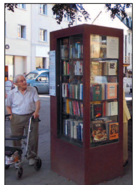
Die Bücher-Box auf dem Marktplatz neben St. Peter und Paul.