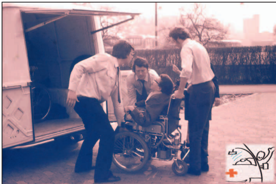
Foto aus den Anfangsjahren des Behindertenfahrdienstes. Muskelkraft musste die fehlende Rampe und Hubvorrichtung ersetzen.

Nach den bisher geltenden Richtlinien dürfen diesen Fahrdienst ausschließlich Personen nutzen, die auf die Benutzung eines Rollstuhles angewiesen sind. Die entsprechenden Richtlinien wurden durch den Kreis Mettmann zum 1. Januar 2017 geändert: Jetzt dürfen alle Personen, die in ihrem Schwerbehindertenausweis das Merkzeichen „aG“ (außergewöhnliche Gehbehinderung) haben und keine Steuervergünstigung in Anspruch nehmen, diesen Fahrdienst für private Fahrten nutzen dürfen. Der Eigenanteil wurde von 20 auf 30 Cent pro Kilometer erhöht. Für die bisher Berechtigten gilt noch eine Übergangszeit bis einschließlich 30. Juni.