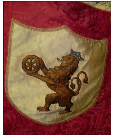
Ausschnitt aus der Fahne des katholischen Arbeitervereins mit dem Ratinger Stadtwappen (1904).

Oft bewundert werden auch die Vereinsfahnen, Zeugnisse längst vergangener Zeiten, zum Teil sehr schön gestaltet und mit unterschiedlichen Motiven bestickt. Früher wurden die Fahnen öffentlich gezeigt, heute existieren Sie nur noch als Archivgut. Zu diesem textilen Bereich gehören auch die vielen Messgewänder, die aber zum größeren Teil auch in ent-