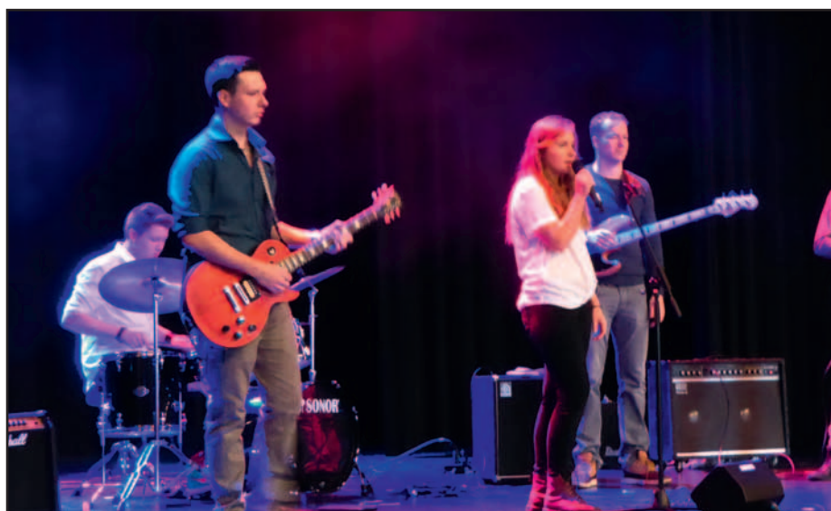
Die „NuCombo“, die Jazz-Rock-Formation der Städtischen Musikschule, in Aktion.

FTS = Ferdinand-Trimborn-Saal, Poststraße 23 Der Eintritt ist frei.