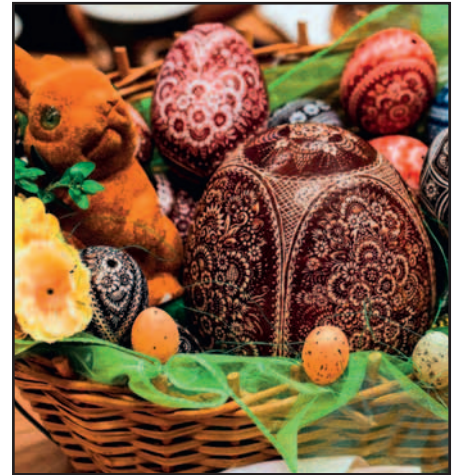
Ostereier in Kratz- und Gravurtechnik sind in Hösel zu sehen.

Den Veranstaltern geht es vor allem darum, Traditionen zu pflegen, die regionale Kultur zu beleben und in der Bevölkerung bekannt zu machen. Bewertet werden deshalb ausschließlich Arbeiten, die in den für die Region charakteristischen traditionellen Techniken hergestellt werden: Kratz- beziehungsweise