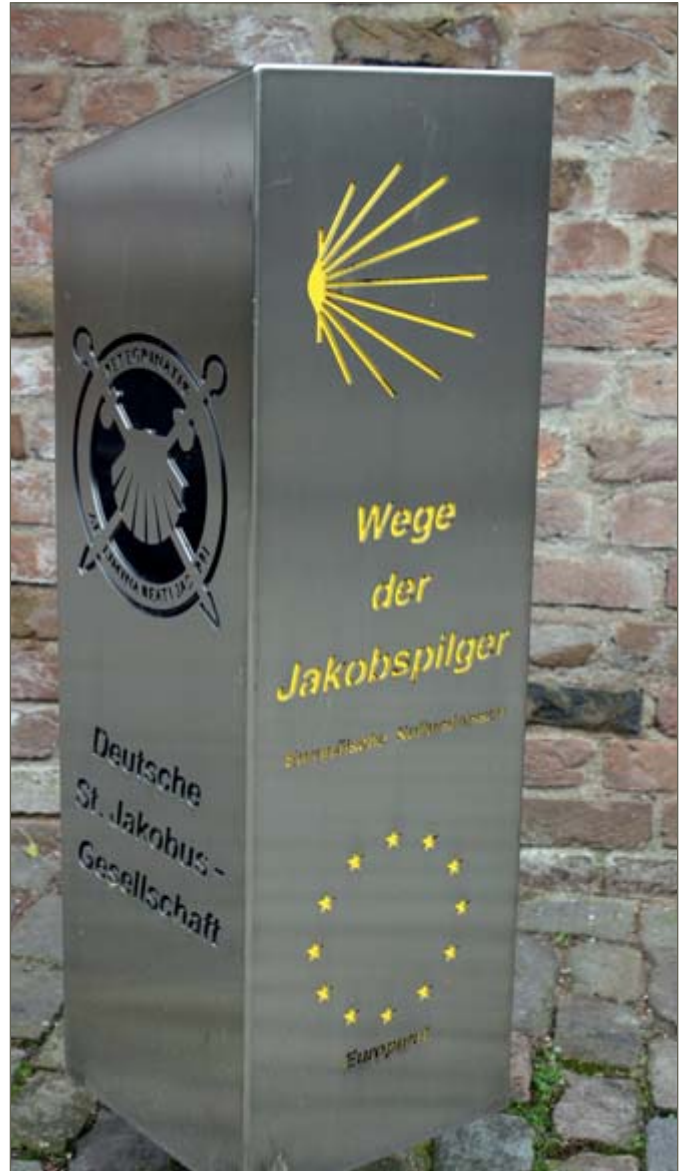
In Homberg, das sich zu einem Jakobuszentrum entwickelt hat, findet man diese Infosäule.

Finden sich auch solche Pilgerwege bei uns in Ratingen? Kurze Antwort: Ja! Seit dem frühen Mittelalter gab es den Pilgerweg vom Bergischen Land nach Kaiserswerth zum Grab des hl. Suitbertus. Dieser Heilige wird auch „Apostel des Bergischen Landes“ genannt. Darum kam irgendwann der Wunsch auf, ihn zu besuchen, der doch die Vorfahren zu Christen gemacht hatte. Die Ratinger haben zu diesem Heiligen ja eine besondere Beziehung, wovon die bekannte „Dumeklemmer-Legende“ berichtet: Die alten Ratinger wollten die Botschaft Jesu, die ihnen Suitbertus nahebrin-