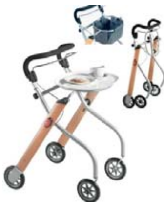
Indoor - Rollator

Bleiben Sie mobil Gratis Rollator Sicherheitscheck