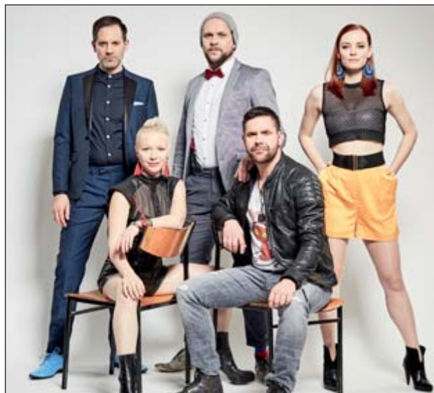
Die Gruppe „Onair“ gastiert bei „Voices“.