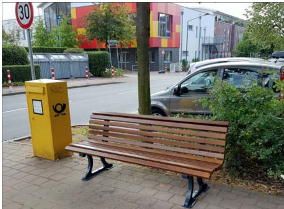
Im Stadtgebiet werden 20 weitere Sitzbänke aufgestellt.

In diesem Zusammenhang gab es auch Bürgerwerkstätten und Stadtpaziergänge, um die Öff-