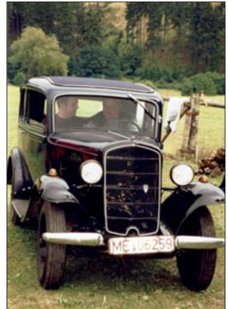
Der Opel P 4 hat inzwischen 81 Jahre auf dem Buckel.

Seine Liebe zu Opel hat Tünkers aber wieder aufleben lassen, indem er sich einen echten Oldtimer angeschafft hatte: einen Opel P4, Baujahr 1937. „Den kann man fahren, aber nur wenn