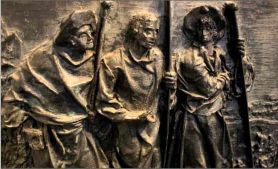
Pilgergruppe auf dem Tabernakel, geschaffen von dem Düsseldorfer Künstler Bert Gerresheim.