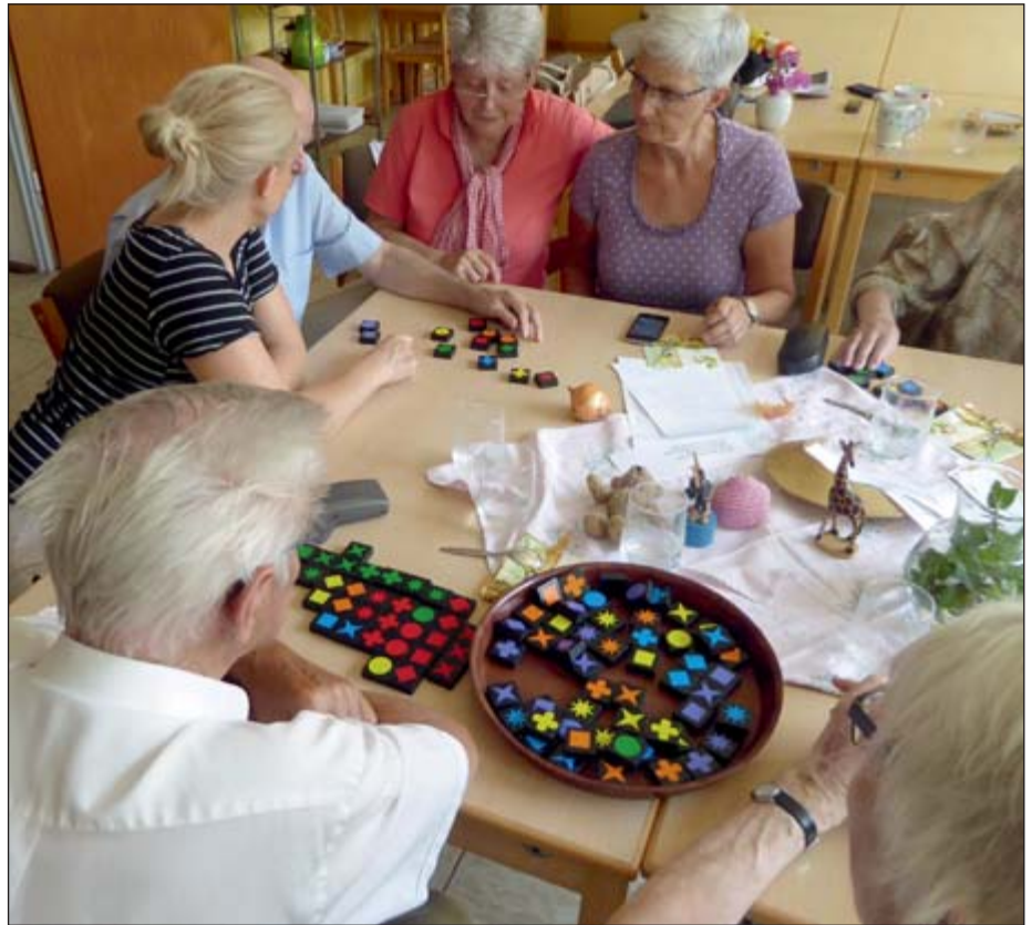
Miteinander reden und spielen: Die ehrenamtlichen Mitarbeiterinnen der „Klöntür“ kümmern sich intensiv um ihre Gäste.

Fast auf den Tag genau vor zehn Jahren öffnete sich die „Klöntür“ im Homberger Jugendheim am Grashofweg zum ersten Mal. Seitdem steht sie alle 14 Tage (außer an Feiertagen) am Donnerstagnachmittag für Menschen mit Demenz und deren Angehörige als Treffpunkt und Begegnungsstätte offen. Drei Stunden lang werden die Gäste von geschulten Mitarbeiterinnen der beiden Homberger Kirchengemeinden betreut. Das Angebot ist dabei speziell auf die Bedürfnisse der Besucher ausgerichtet. Die „Klöntür“ ist an die Ratinger Demenzinitiative angegliedert und bildet zusammen mit dem „Café Glockenblume“ in Hösel, der „Weißen Villa“ und dem „Haus Salem“ in Lintorf ein Netz von besonderen Betreuungsangeboten für Demenzkranke. Gemeinsam wird gesungen, gebastelt,