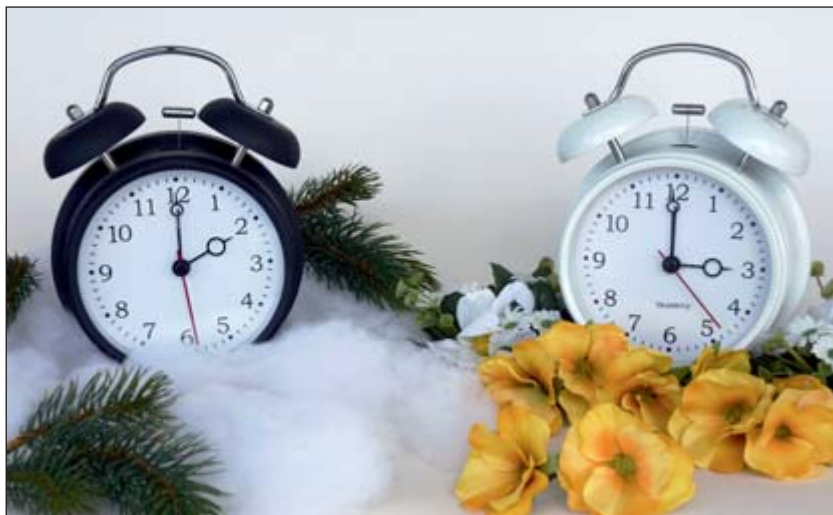
Am 28. Oktober wird die Sommerzeit zurückgestellt.