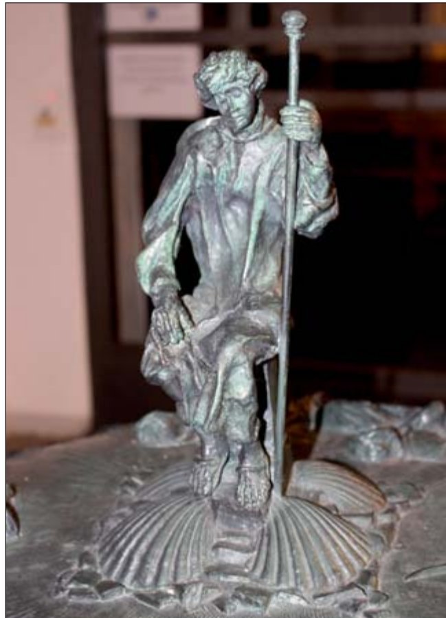
Die Pilger-Statuette auf dem Taufstein in der Homberger St. Jakobus-Kirche.