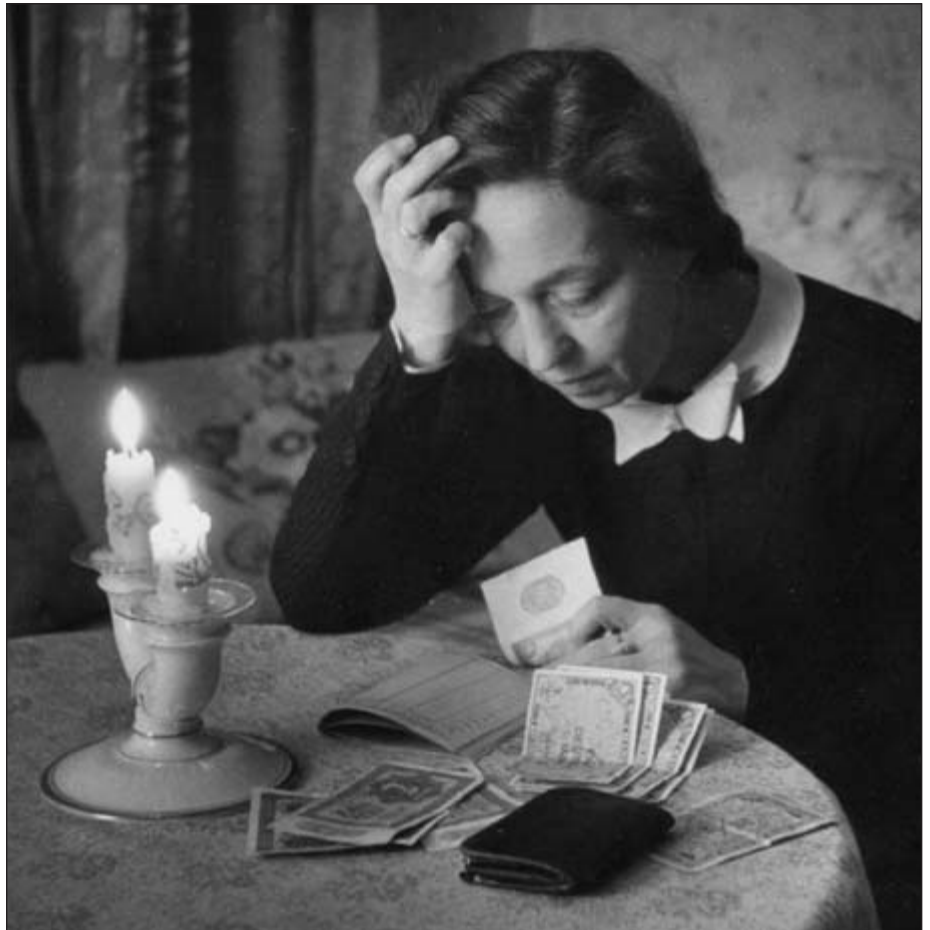
Für viele Menschen war mit der Auszahlung des neuen Geldes die Not aber längst nicht vorbei.