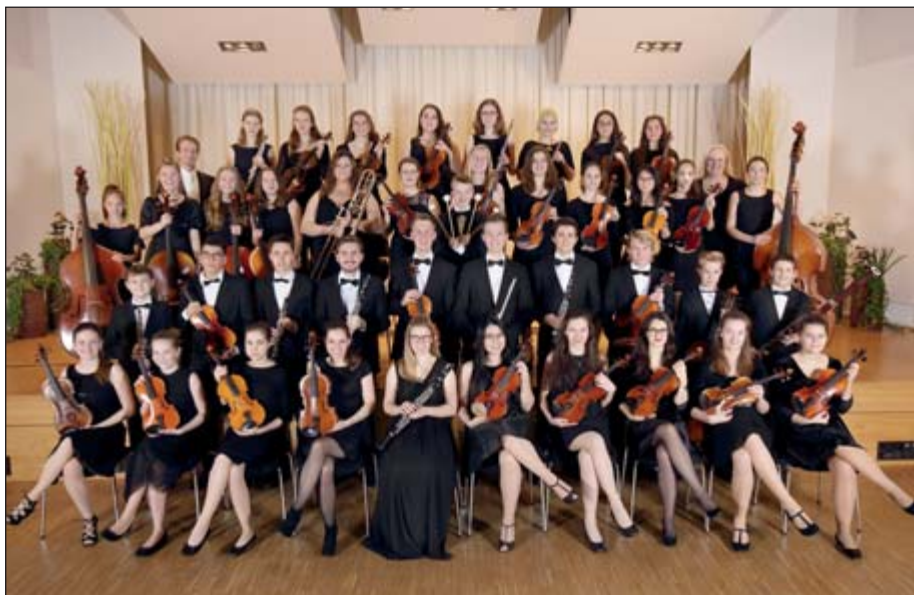
Das Jugendsinfonieorchester der Städt. Musikschule feiert sein 30-jähriges Bestehen am 4. November mit einem Jubiläumskonzert.